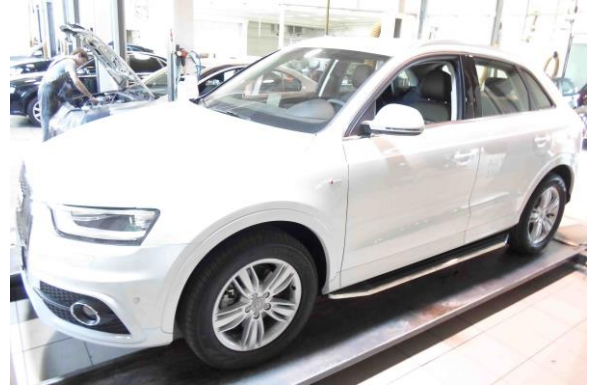
Рис.5 Вид автомобиля с порогом