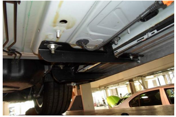
Рис.3 Установка переднего кронштейна