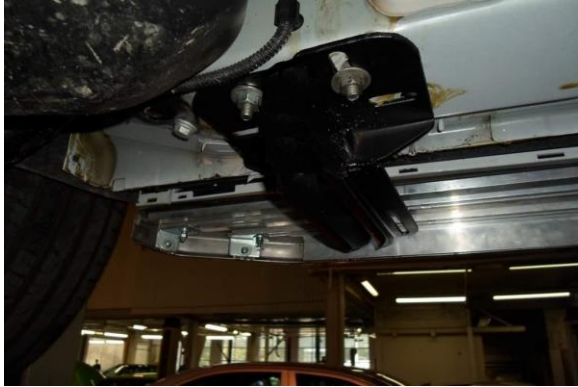
Рис.4 Установка переднего кронштейна