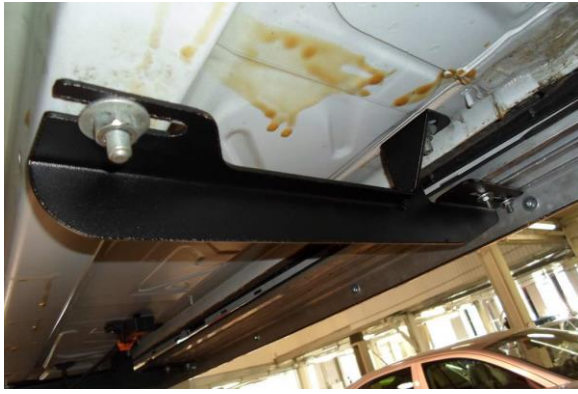
Рис.2 Установка переднего кронштейна