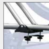
TRAVERSINO IN PLASTICA DI SERIE PER ART. 603 STRONG PLASTIC CROSS PIECE AS STANDARD FOR MOD. 603