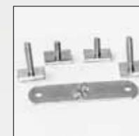
ART. 364 KIT PER BARRA A "T" KIT FOR "T" BAR