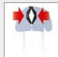
IN NERO, DISPOSITIVO BREVETTATO PER TUBI DI PICCOLO DIAMETRO IN BLACK, CLOSE-UP PATENTED OF CLAMP JAW REDUCER