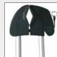
COMPLETO DI CHIAVE ANTIFURTO COMPLETE WITH IN-BUILT LOCKING MECHANISM WITH KEY