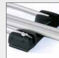
ART. 396 TRAVERSINO CON CHIAVE LOCKABLE CROSS PIECE AVAILABLE ON REQUEST