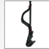
CINGHIA CON ELASTICO ELASTIC STRAP