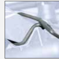
GOMMINO SALVA BICI RUBBER BIKE PROTECTOR