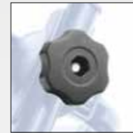
CHIUSURA CON POMELLO CLOSE-UP WITH KNOB