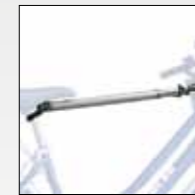
ART. 395 ADATTATORE DONNA/UOMO REMOVABLE CROSSBAR AVAILABLE SEPARATELY