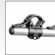
BLOCCAGGIO SINGOLO SINGLE BLOCKING