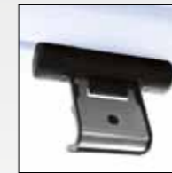
ART. 392 ADATTATORE BAULE IN VETRO GLASS HATCH ADAPTOR