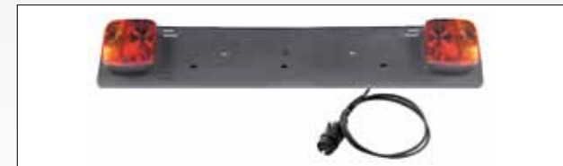
ART. 394 PORTATARGA COMPLETA DI FANALI E SPINA 7 POLI LUNGHEZZA CAVO: 1,5 MT NUMBER PLATE HOLDER COMPLETE WITH LIGHTS AND 7 PIN PLASTIC PLUG CABLE LENGTH: 1,5 MT