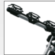
BLOCCAGGIO TRIPLIO TRIPLE BLOCKING