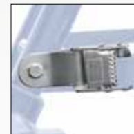
FIBBIA IN ACCIAIO STEEL BUCKLE