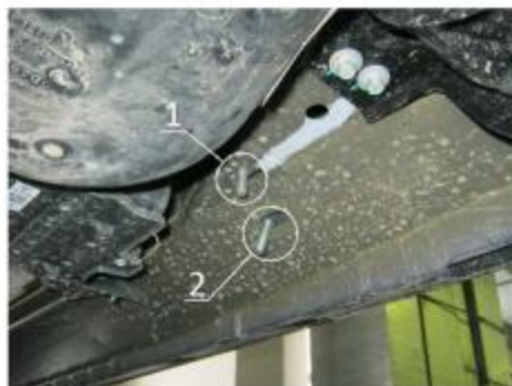
Рис.3 Место крепления заднего кронштейна.