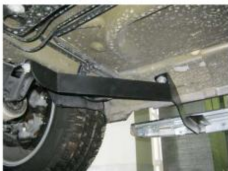
Рис.4 Установка переднего кронштейна.