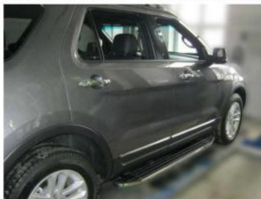
Рис.5 Вид автомобиля с порогом