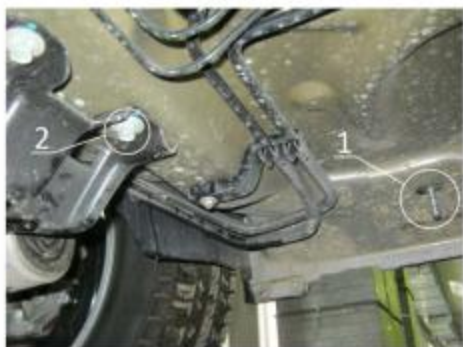
Рис.2 Место крепления переднего кронштейна.