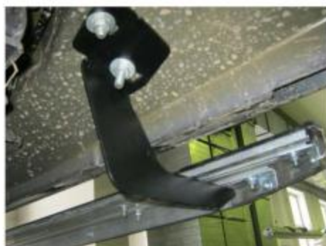
Рис.5 Установка заднего кронштейна.