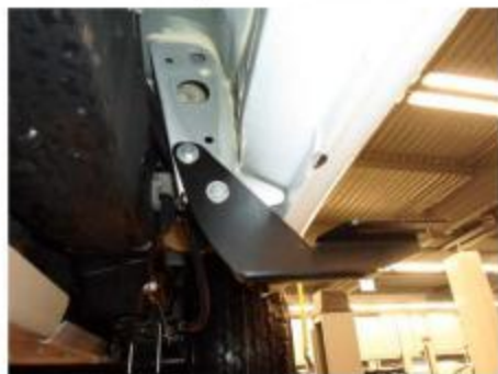
Рис.4 Установка кронштейна в задней части порога автомобиля.