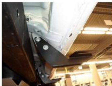
Рис.3 Установка кронштейна в средней части порога автомобиля.