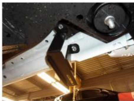
Рис.2 Установка кронштейна в передней части порога автомобиля.