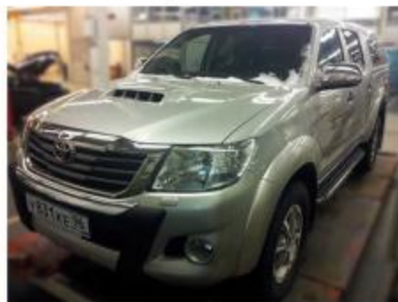
Рис.5 Вид автомобиля с порогом