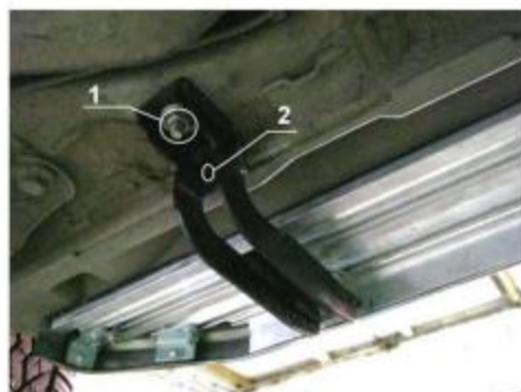
Рис.3 Установка заднего кронштейна