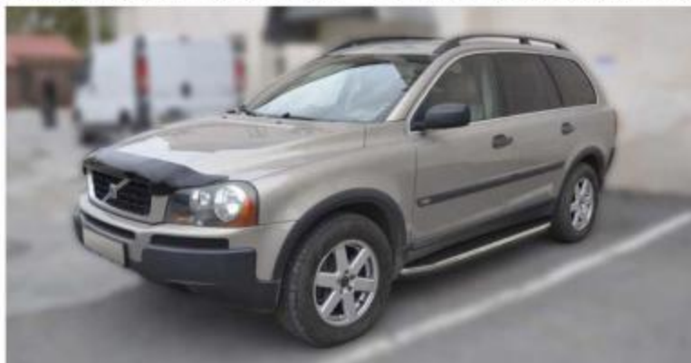
Рис.4 Вид автомобиля с порогом