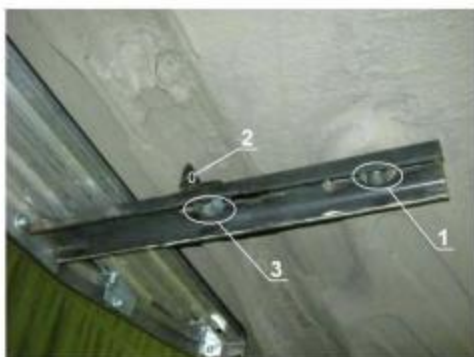
Рис.2 Установка переднего кронштейна