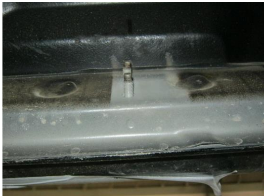
Рис. 2 Место крепления