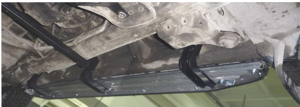
Рис. 4 Вид установленных кронштейнов