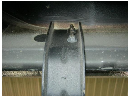
Рис. 3 Установка кронштейна