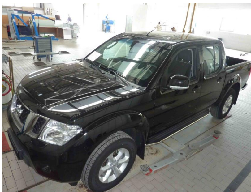
Рис. 5 Вид автомобиля с порогом