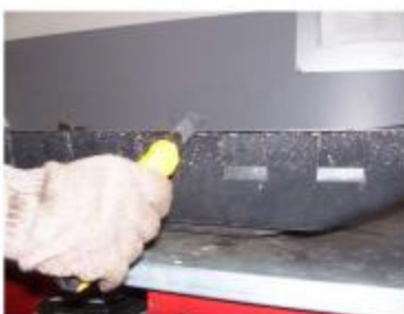
Рис.6 Пазы в пластиковом пыльнике