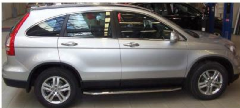
Рис.8 Вид автомобиля с порогом