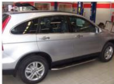
Рис.7 Вид автомобиля с порогом