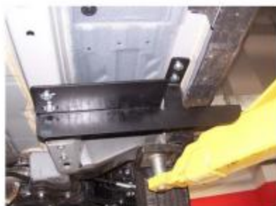
Рис.4 Установка переднего кронштейна