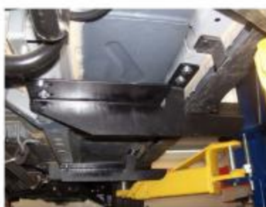
Рис.5 Установка заднего кронштейна