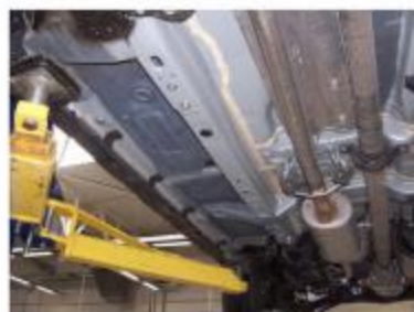
Рис.3 Снятие пыльников