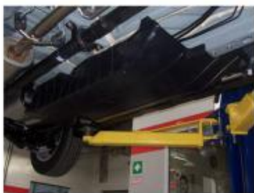
Рис.2 Пыльник автомобиля