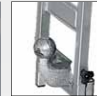
DISPOSITIVO GANCIO ALLA PIASTRA REAR TOWBALL PLATE MOUNTED