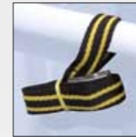
CINGHIA DI SICUREZZA SAFETY STRAP