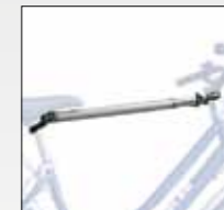
ART. 395 ADATTATORE DONNA/UOMO REMOVABLE CROSSBAR AVAILABLE SEPARATELY