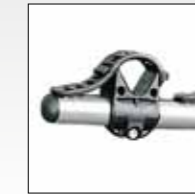
BLOCCAGGIO SINGOLO SINGLE BLOCKING