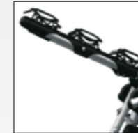
BLOCCAGGIO TRIPLO TRIPLE LOCKING