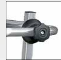
CHIUSURA CON POMELLO CLOSE-UP WITH KNOB