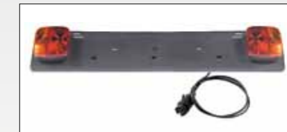
ART. 394 PORTATARGA COMPLETA DI FANALI E SPINA 7 POLI LUNGHEZZA CAVO: 1,5 MT NUMBER PLATE HOLDER COMPLETE WITH LIGHTS AND 7 PIN PLASTIC PLUG CABLE LENGTH: 1,5 MT