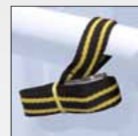
CINGHIA DI SICUREZZA SAFETY STRAP