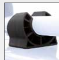
APPOGGI MAGGIORATI EXTRA LARGE CUSHIONED PADS