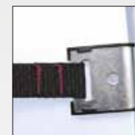
GANCIO TEMPRATO HIGH-STRENGTH TEMPERED HOOKS