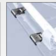
ART. 955 ATTACCO RIGIDO SUPERIORE RIGID TOP FIXING BRACKETS