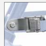
FIBBIA IN ACCIAIO STEEL BUCKLE