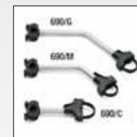
ART. 690 BRACCETTI A CRICK IN ALLUMINIO RATCHET ALUMINIUM BIKE GRAB ARMS