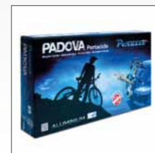
ART. 650-650/3 SCATOLA FULL COLOR BOX