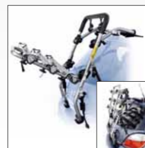
ART. 378-378/3 PADOVA VERSIONE IN FERRO PADOVA STEEL VERSION