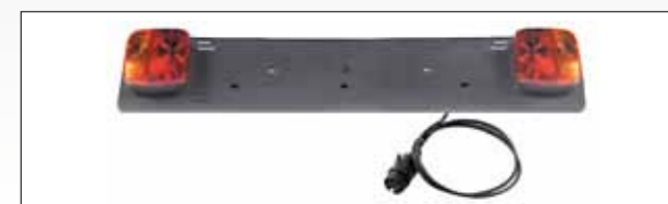
ART. 394 PORTATARGA COMPLETA DI FANALI E SPINA 7 POLI LUNGHEZZA CAVO: 1,5 MT NUMBER PLATE HOLDER COMPLETE WITH LIGHTS AND 7 PIN PLASTIC PLUG CABLE LENGTH: 1,5 MT