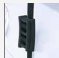
TENSORE ANTIDISTACCO BUMP ABSORBERS