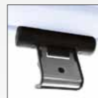
ADATTATORE BAULE IN VETRO GLASS HATCH ADAPTOR