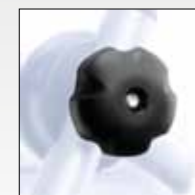
CHIUSURA CON POMELLO (DI SERIE PER ART. 378 - 378/3, A RICHIESTA PER ART. 650 - 650/3) CLOSE-UP WITH KNOB (AVAILABLE FOR ART. 378 - 378/3, ON REQUEST FOR ART. 650 - 650/3)