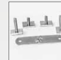
ART. 364 KIT PER BARRA A "T" KIT FOR "T" BAR