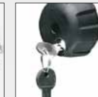
ART. 365 POMELLO ANTIFURTO SECURITY KNOB