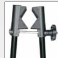
GOMMINO SALVATELAIO RUBBER TUBE PROTECTOR