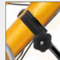
PARTICOLARE FISSAGGIO CLOSE UP OF CLAMP